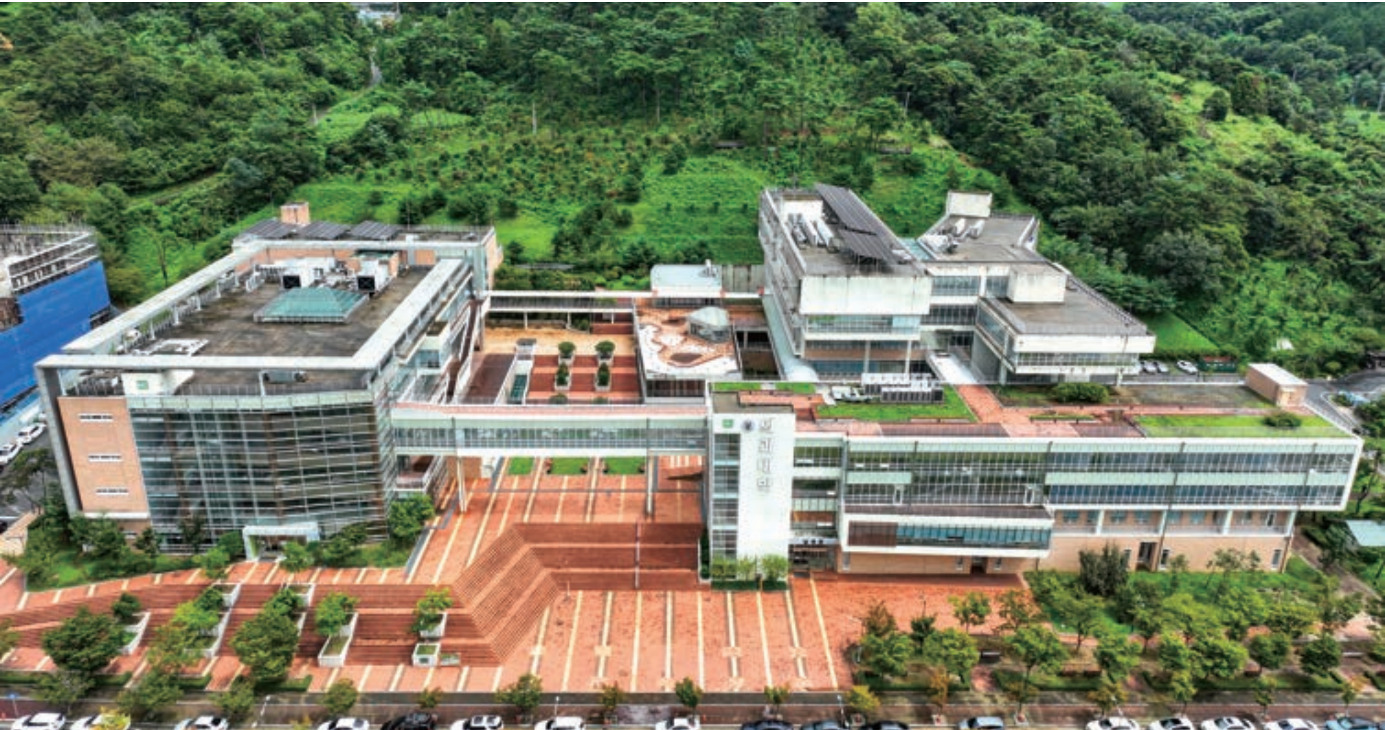
첨단바이오메디컬의 거점 화순캠퍼스