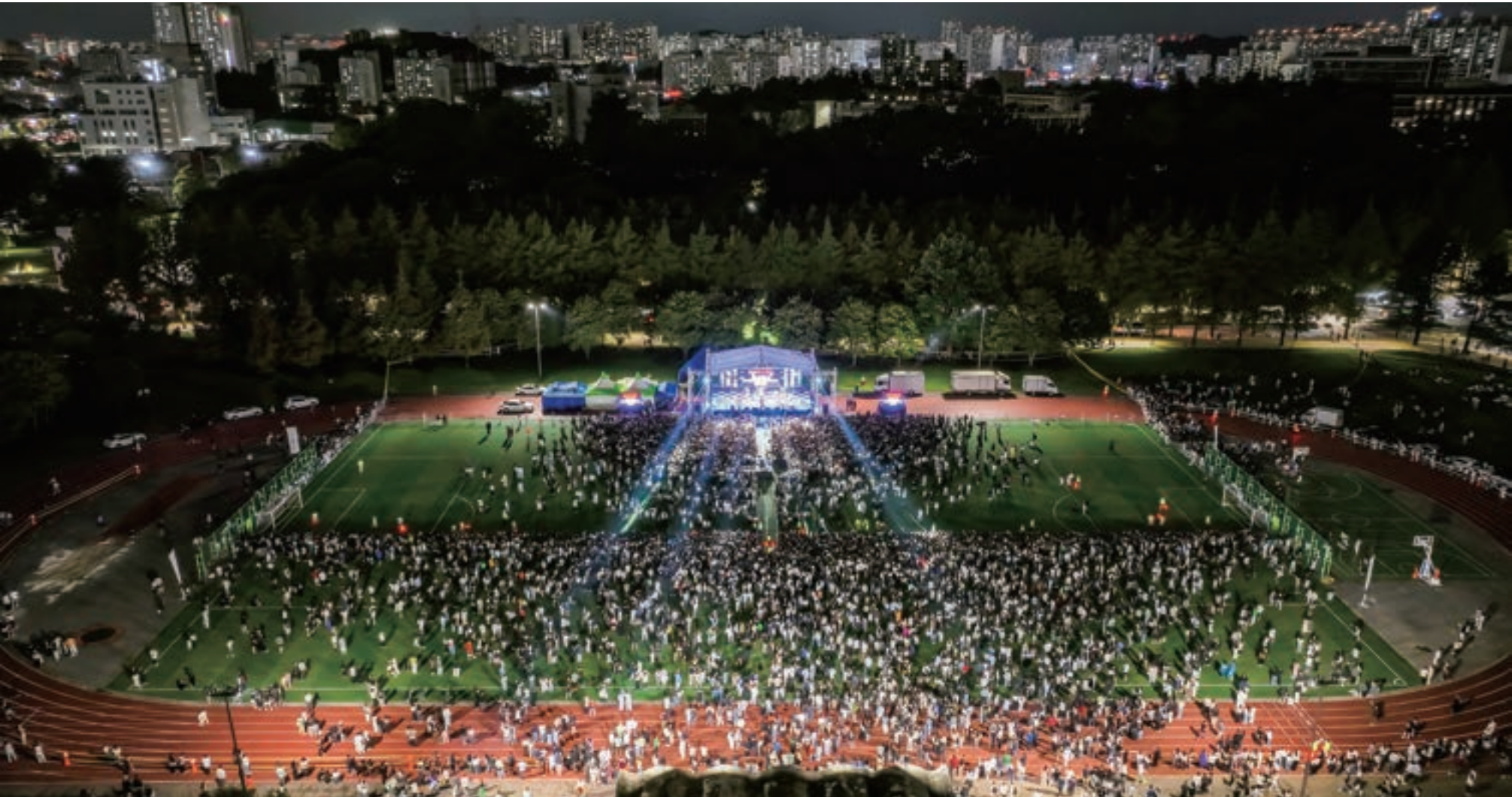
열정으로 가득 메운 축제의 환호