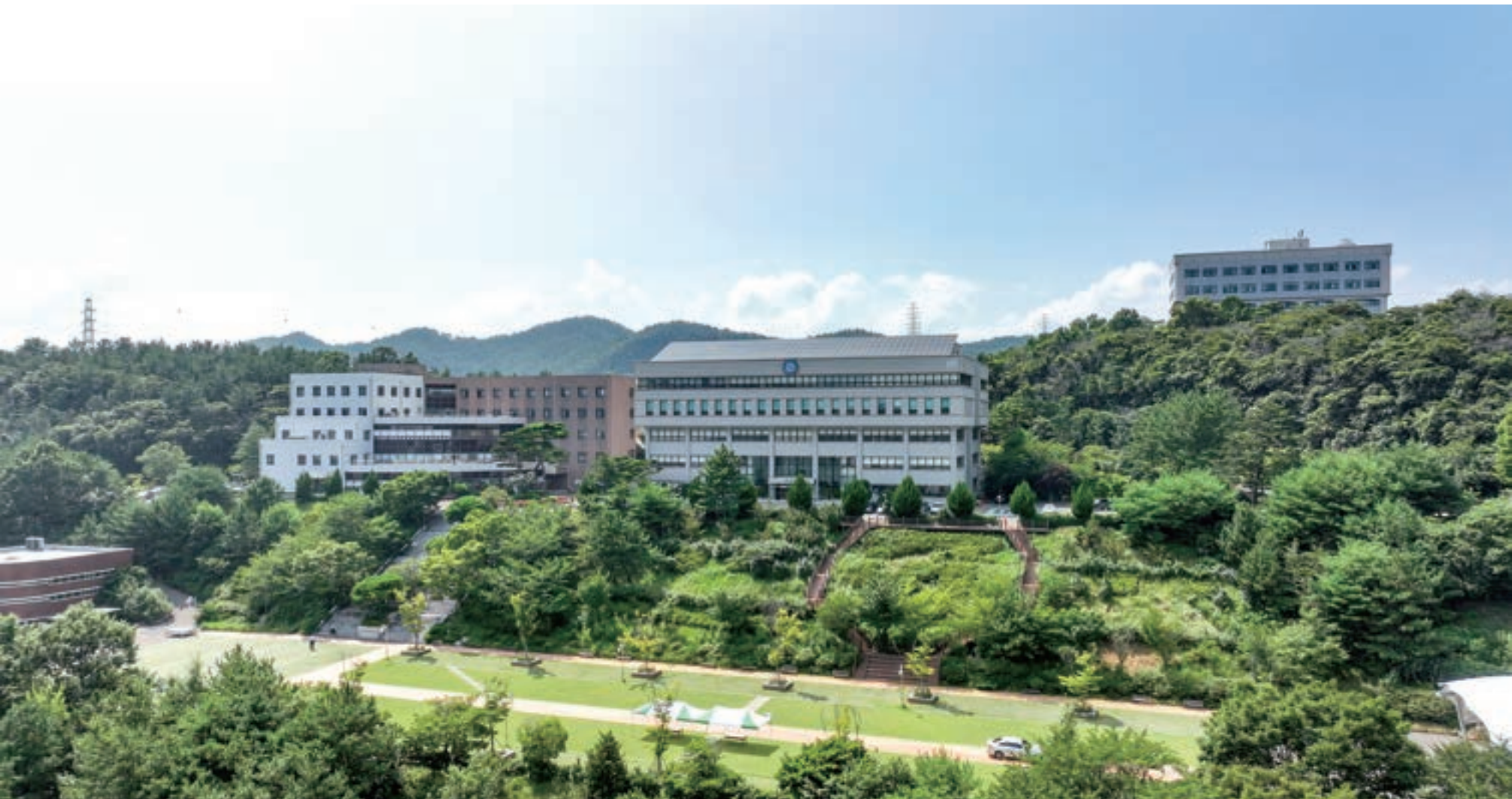
자연과 학문이 어우러진 아름다운 여수캠퍼스