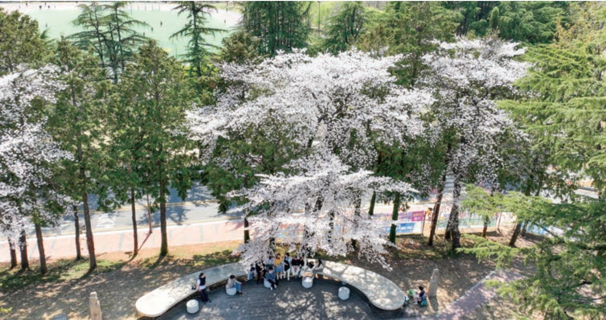
꽃보다 아름다운 그 이름, 청춘