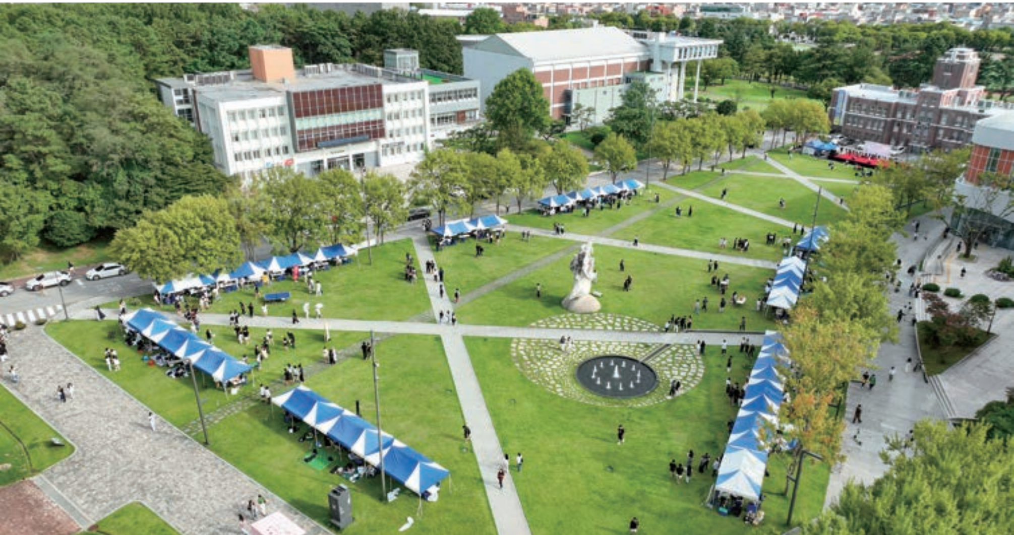
캠퍼스와 함께하는 설레는 만남