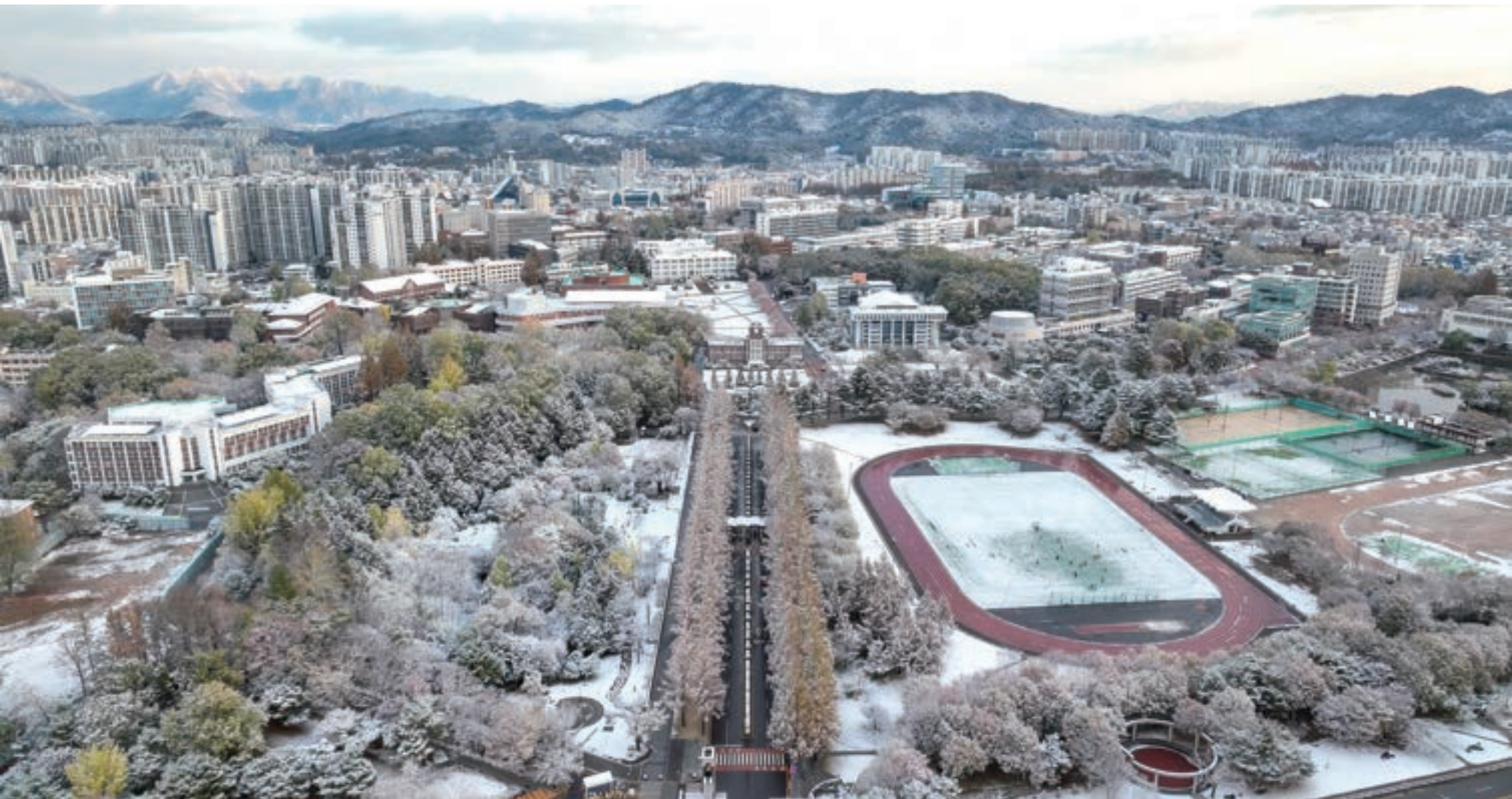
새하얀 설경, 눈부신 전남대학교