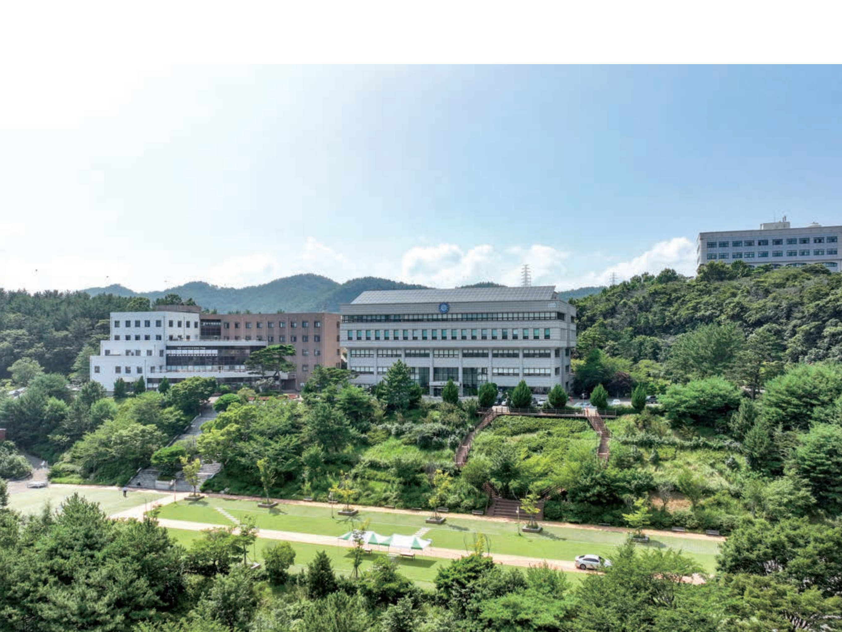
자연과 학문이 어우러진 아름다운 여수캠퍼스