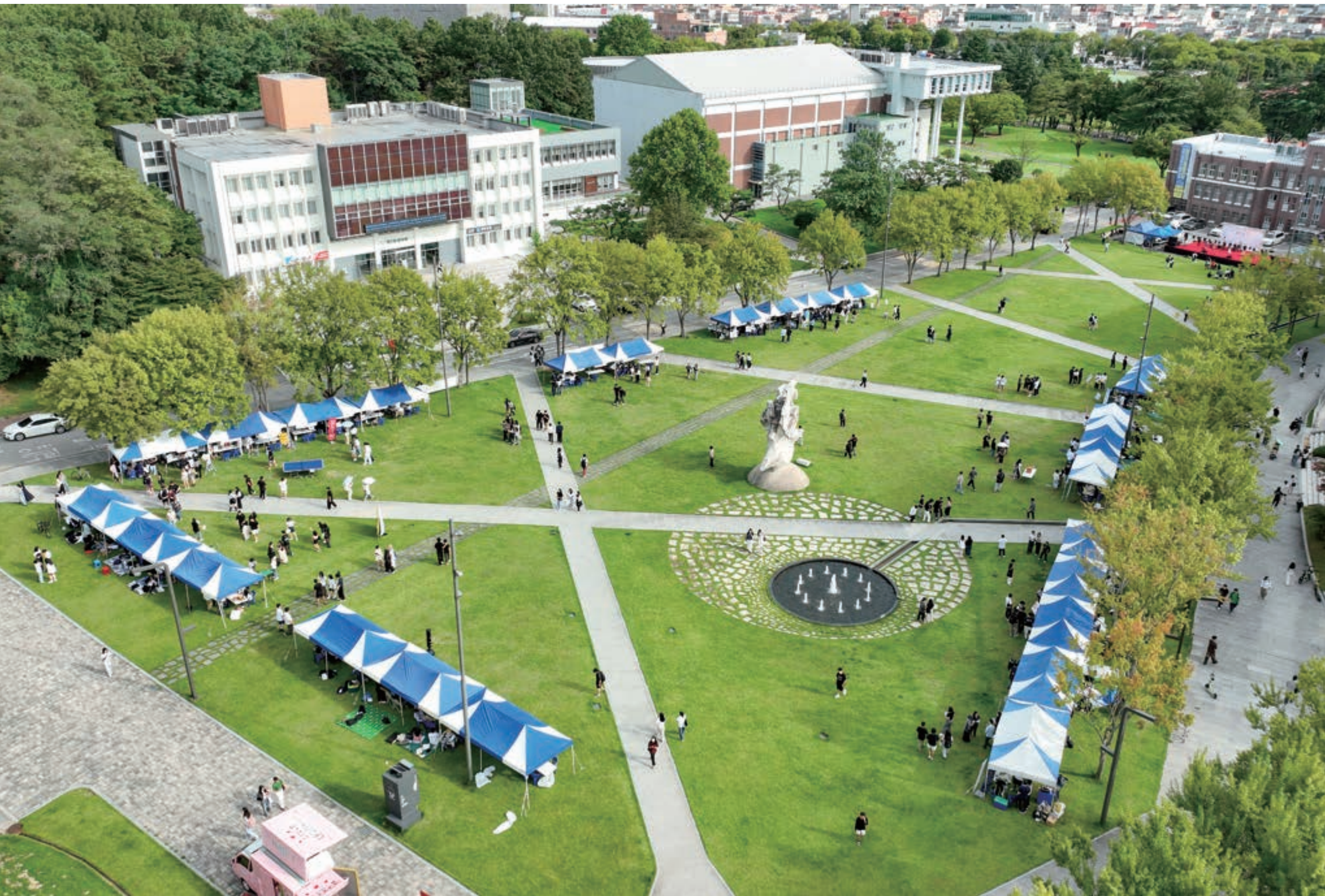
캠퍼스와 함께하는 설레는 만남