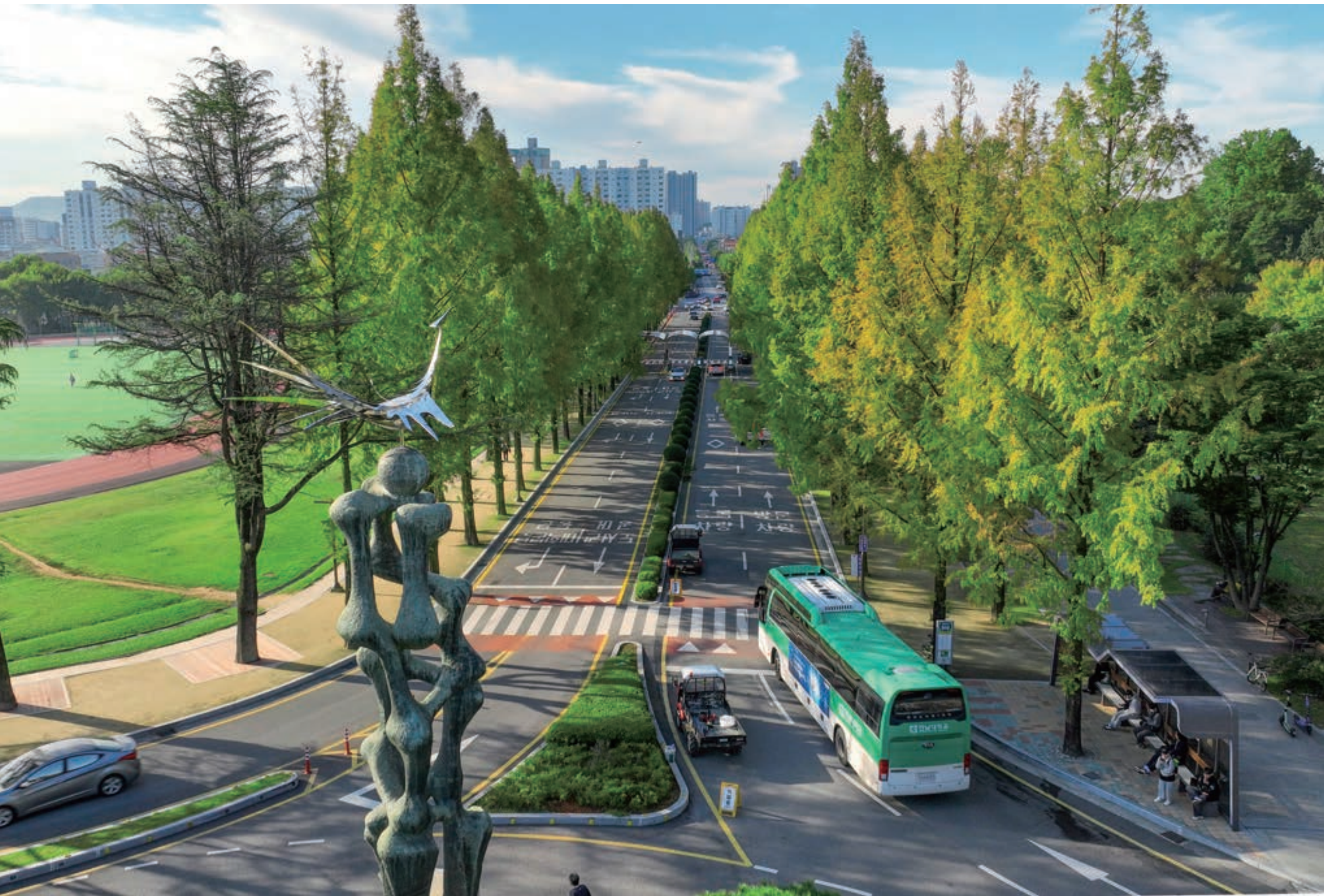
진리를 향해 곧고 푸른 기상으로