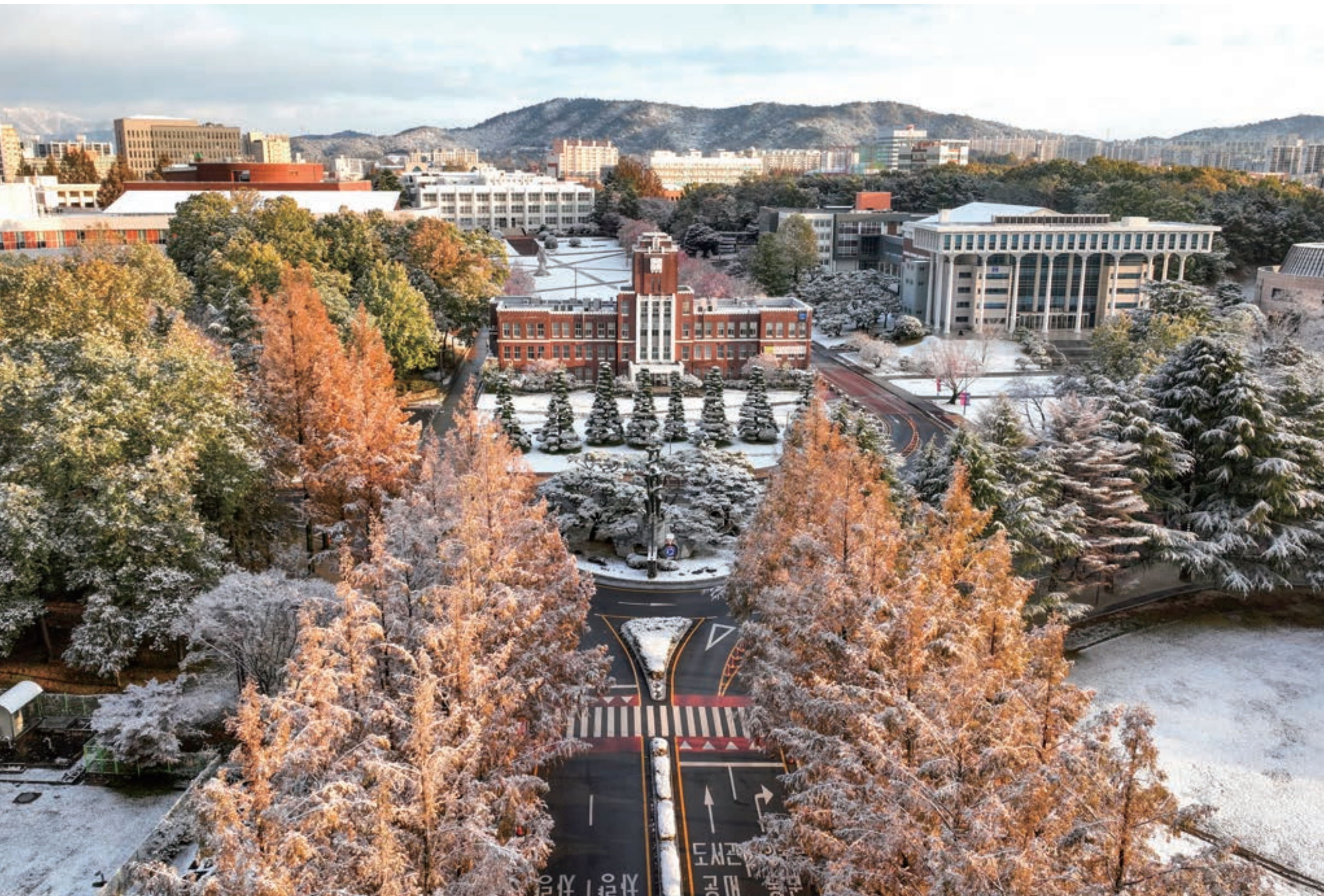
눈꽃처럼 순수한 학문의 전당