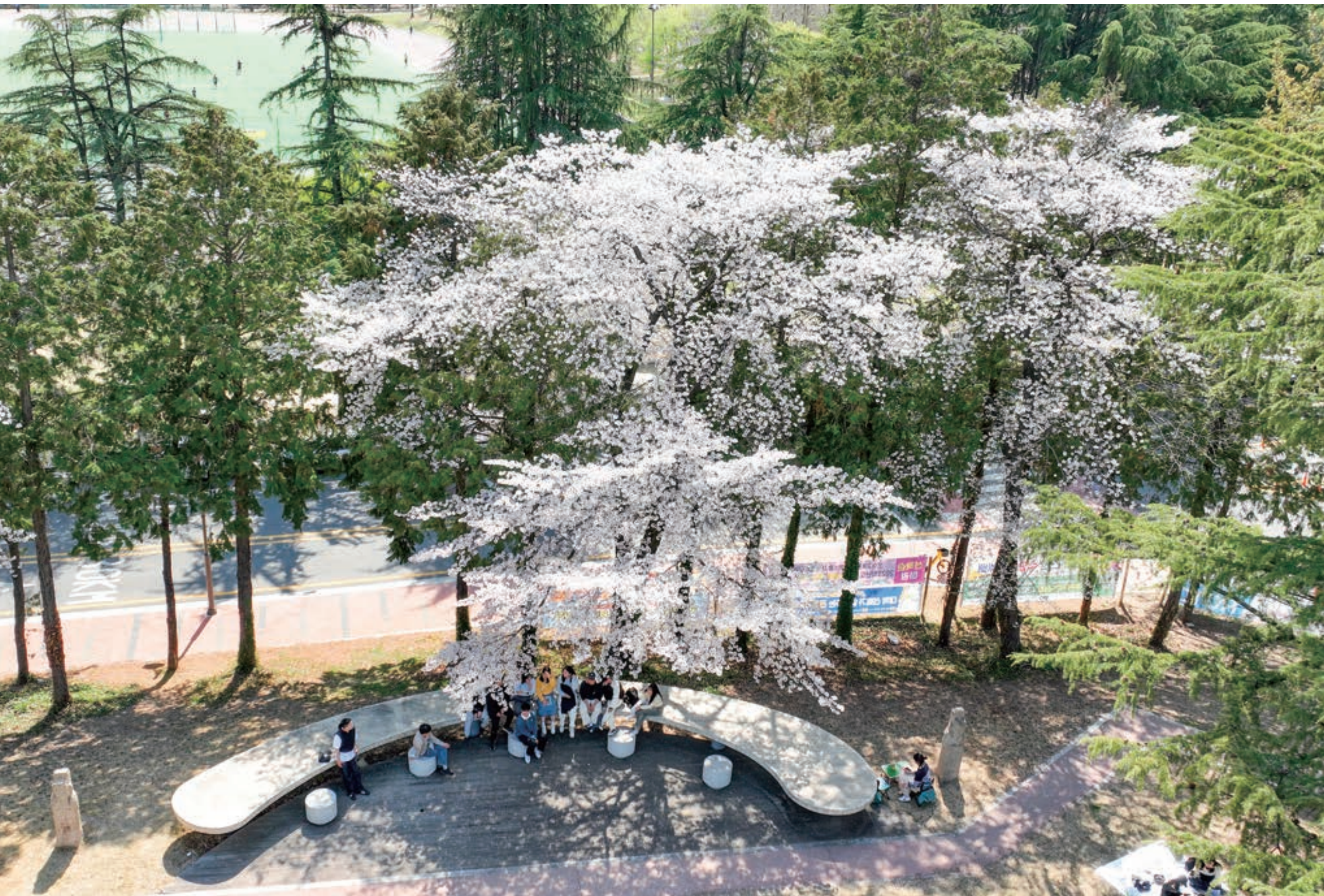
꽃보다 아름다운 그 이름, 청춘