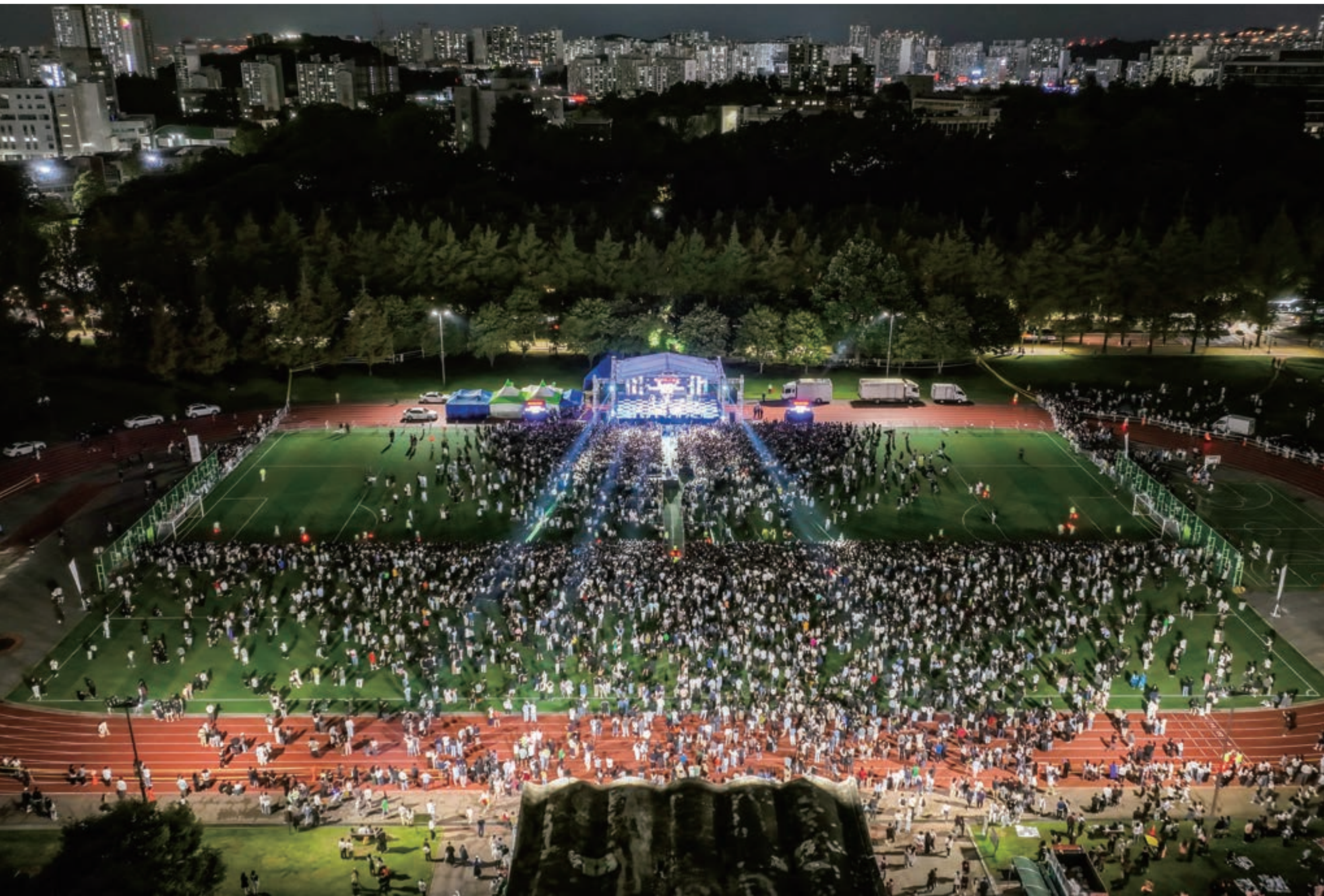
열정으로 가득 메운 축제의 환호