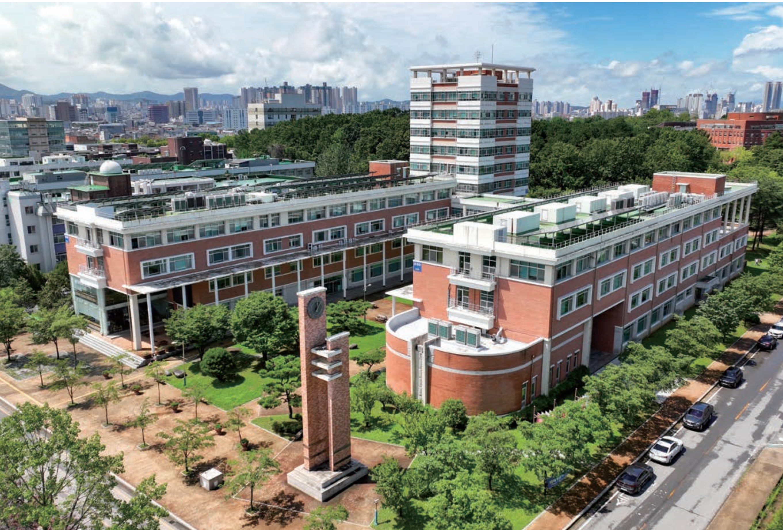
시계처럼 멈추지 않는 연구의 산실