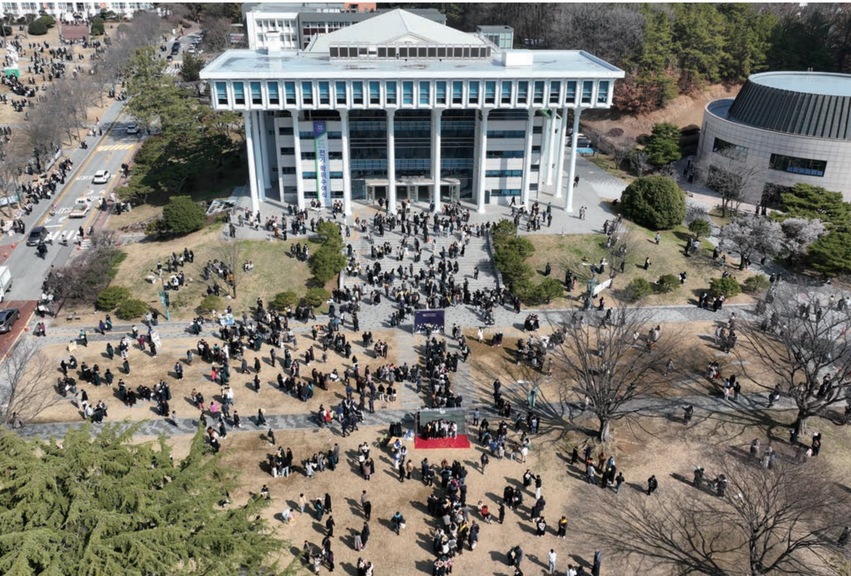
설렘과 기대 속에 새로운 시작