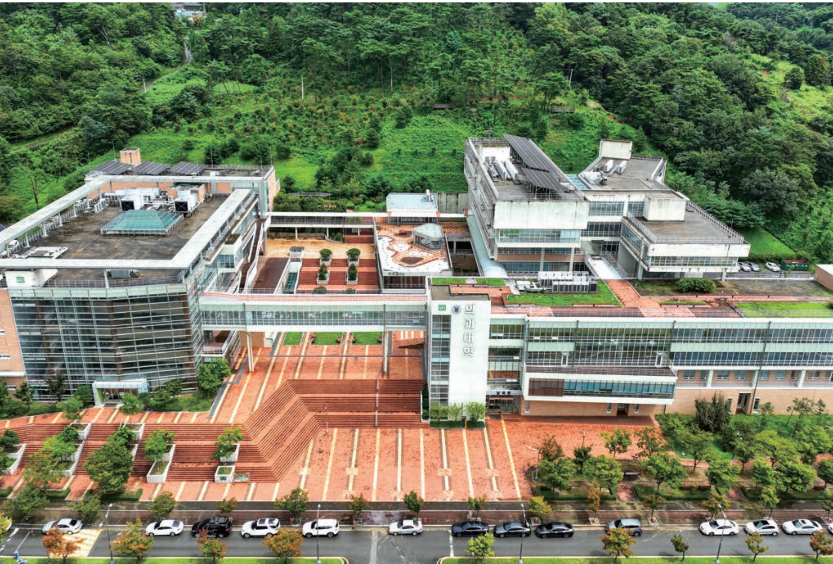
첨단바이오메디컬의 거점 화순캠퍼스