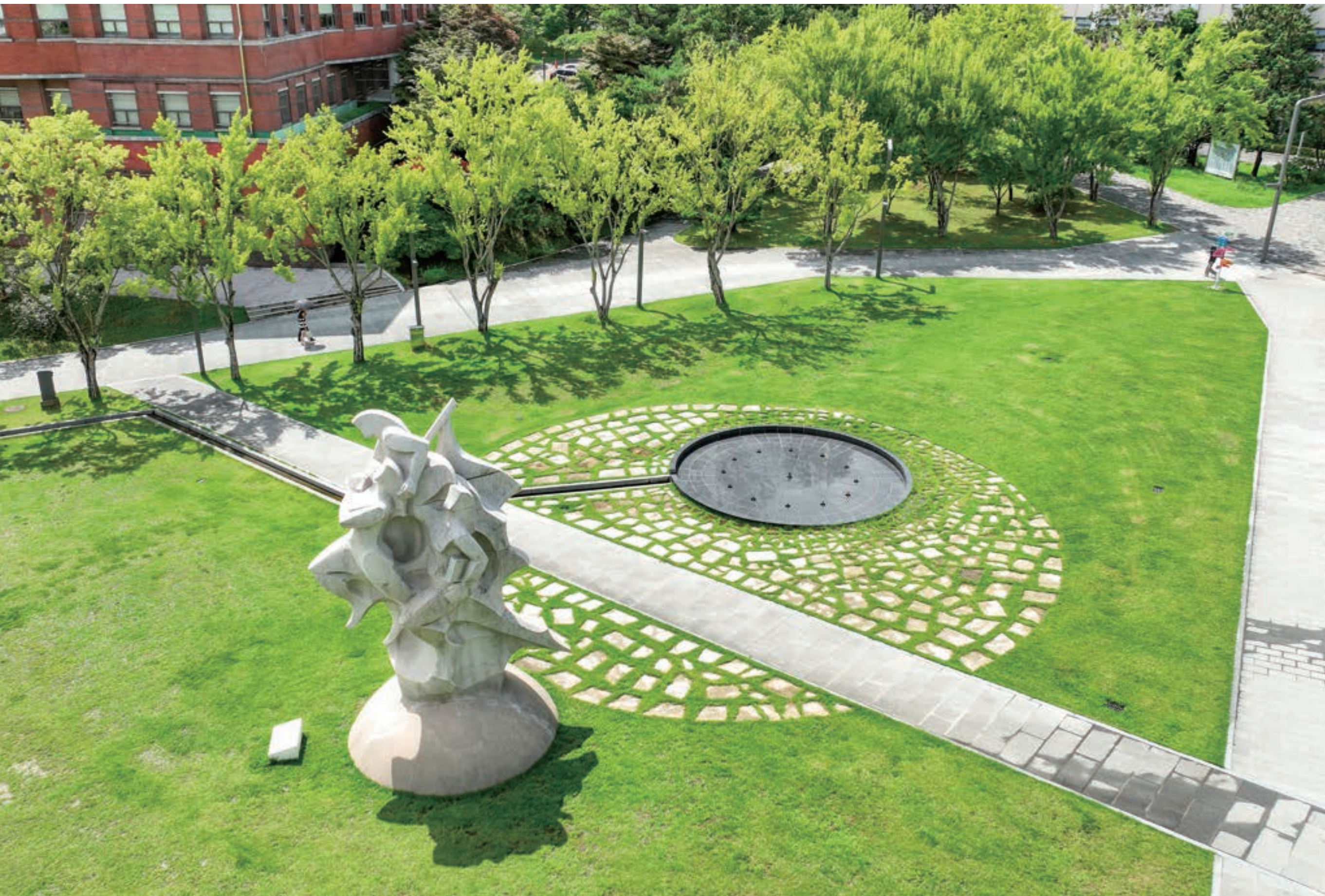
내딛은 걸음마다 오월의 함성