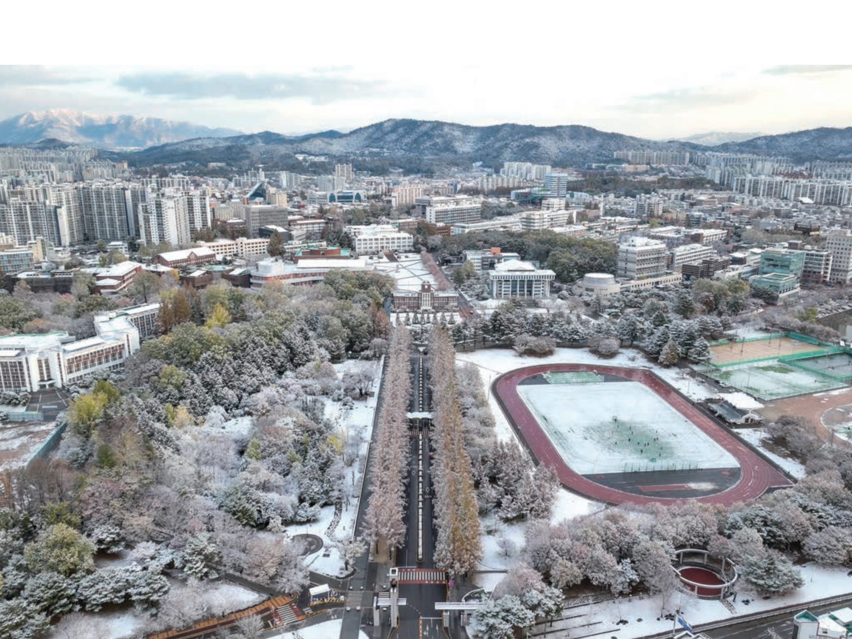
새하얀 설경, 눈부신 전남대학교