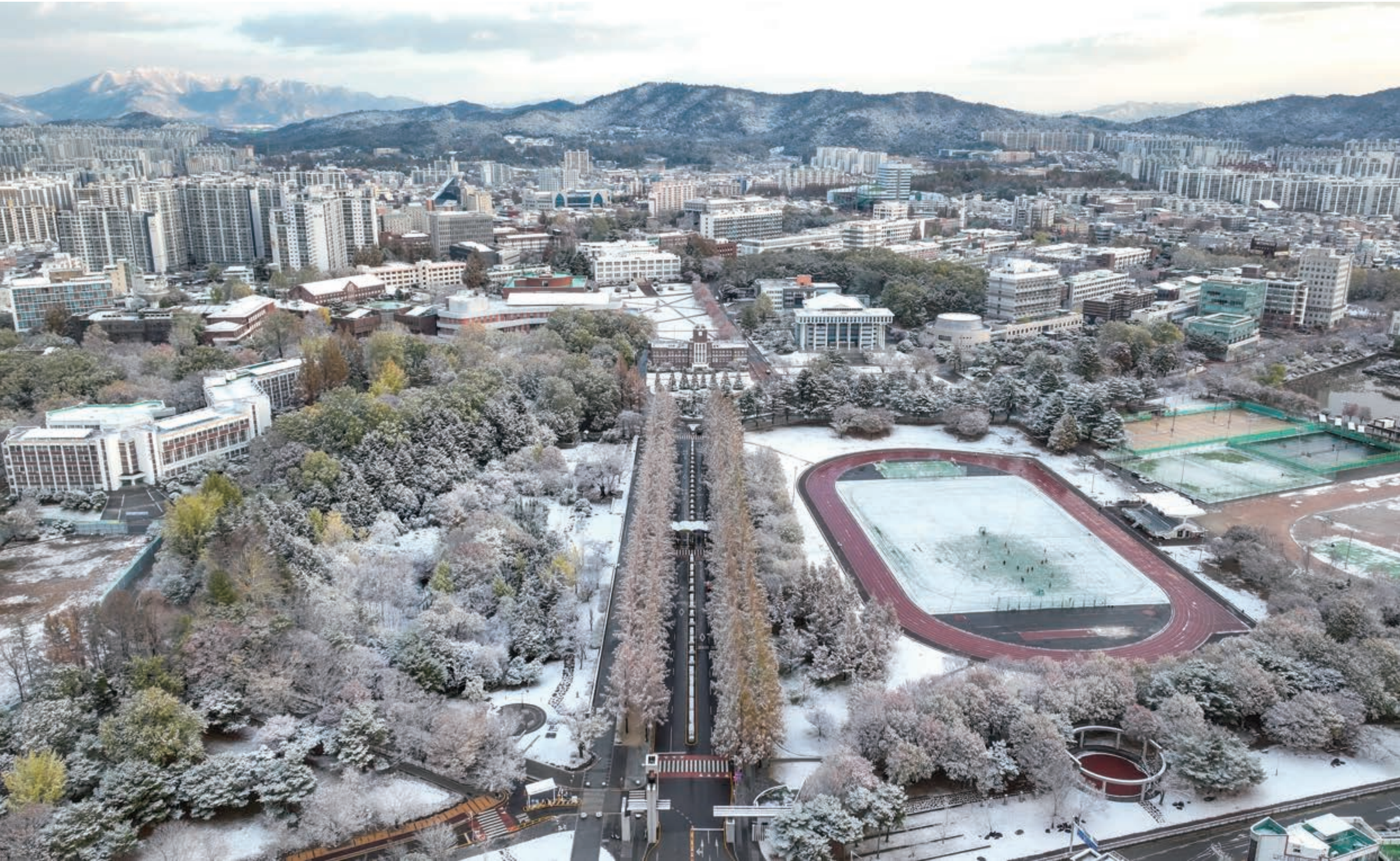
새하얀 설경, 눈부신 전남대학교