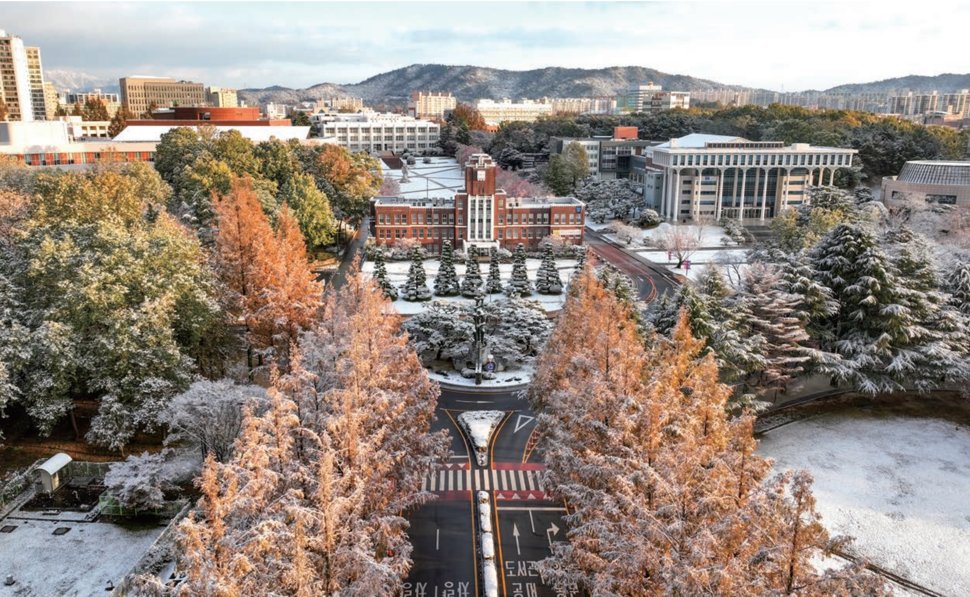
눈꽃처럼 순수한 학문의 전당