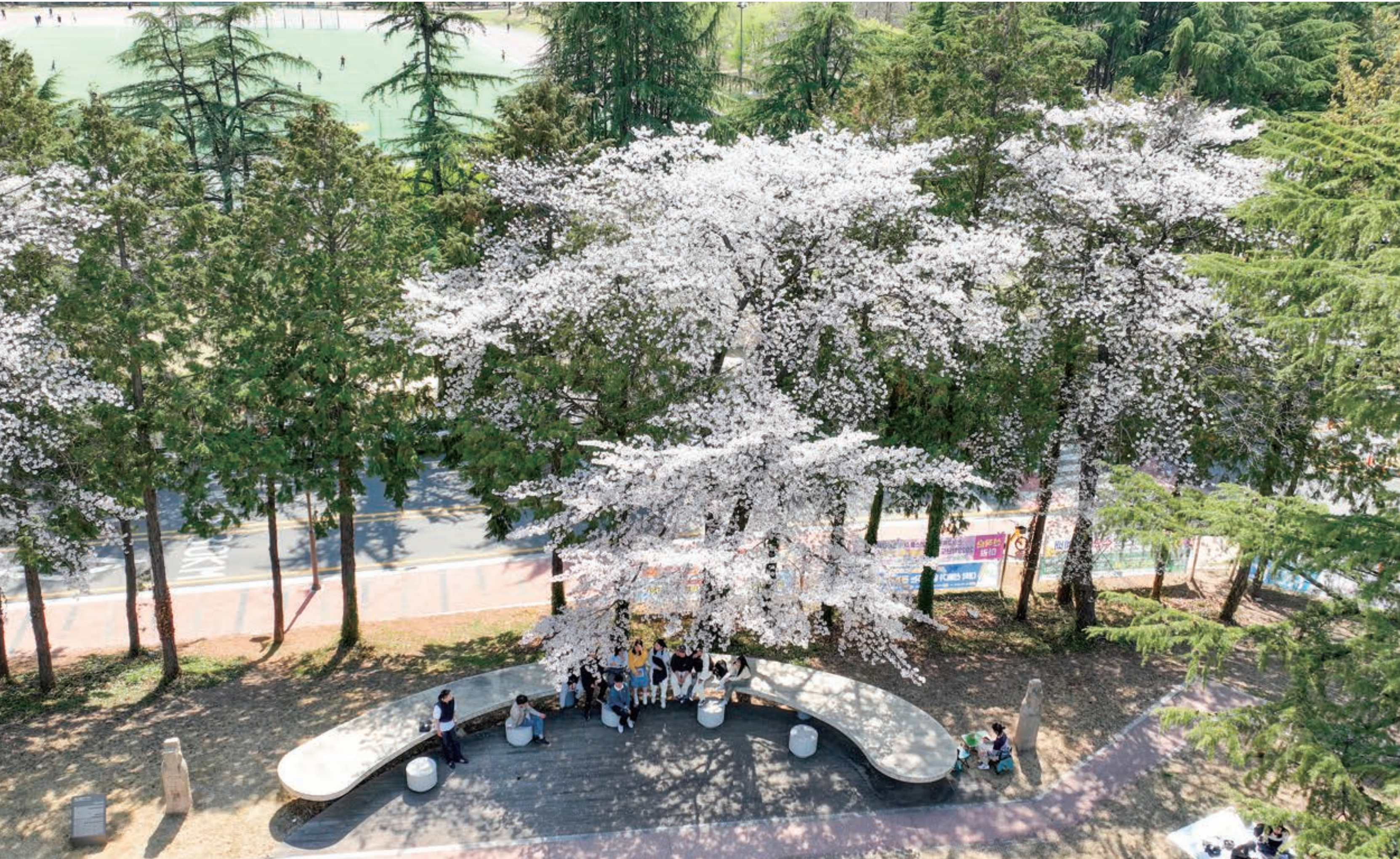
꽃보다 아름다운 그 이름, 청춘