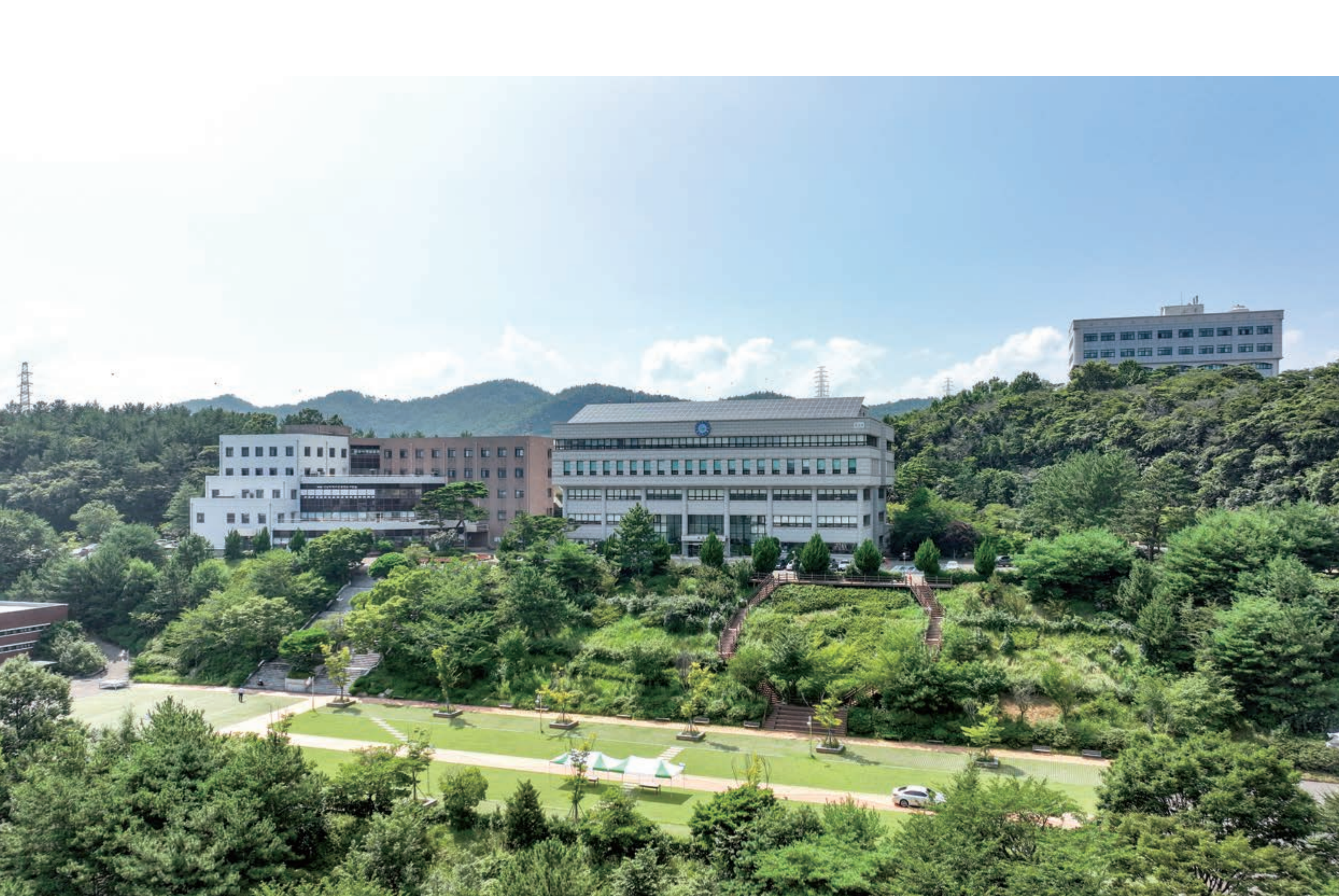
자연과 학문이 어우러진 아름다운 여수캠퍼스