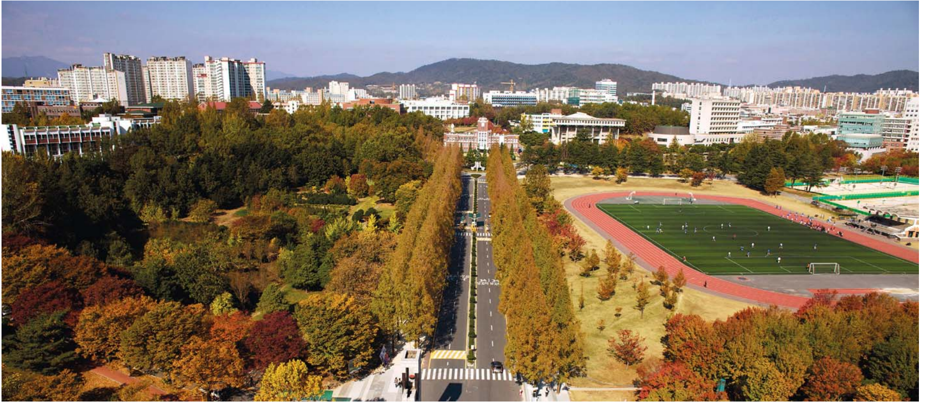
소통하는 대학, 지역민과 함께 호흡하다