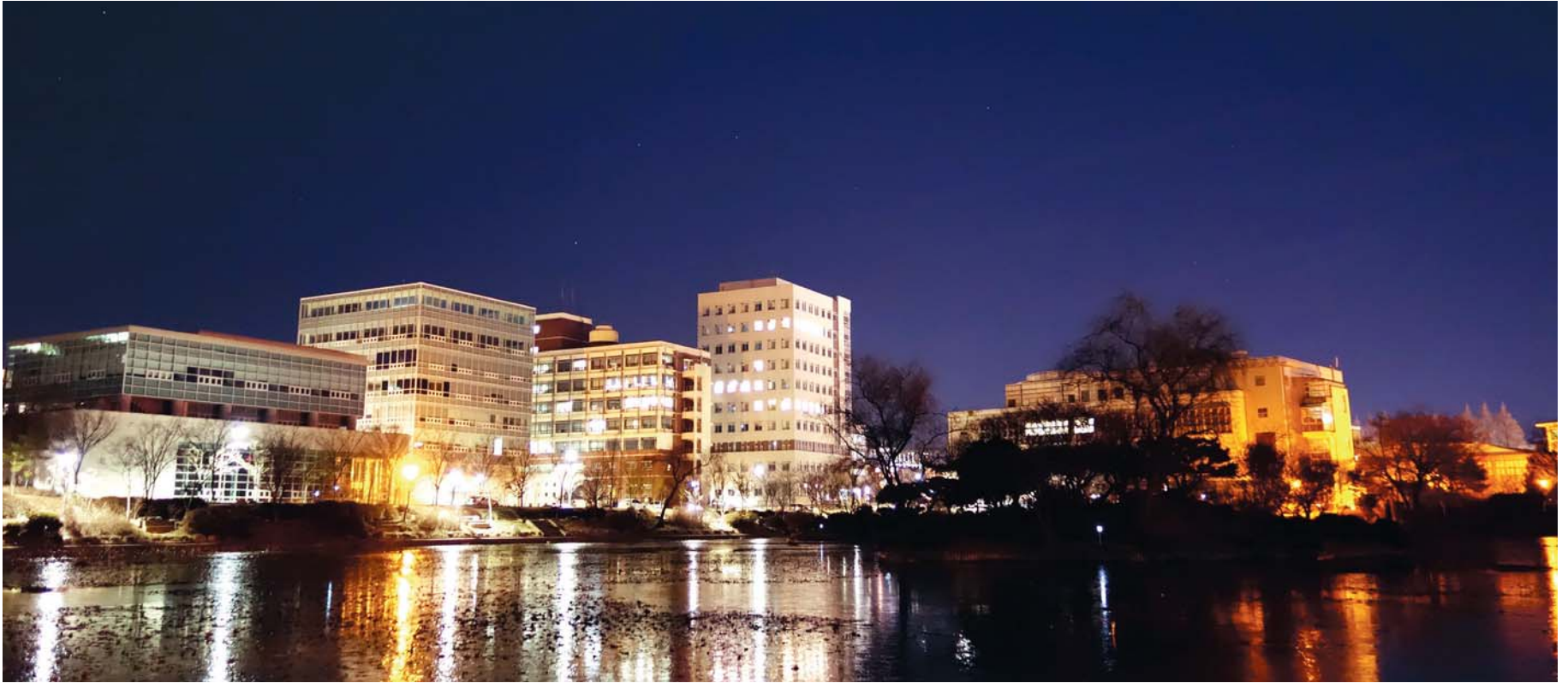
희망의 빛으로 내일을 밝히다