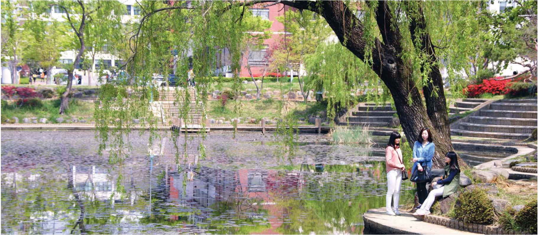
미래를 위한 사색, 혁신의 길을 묻다