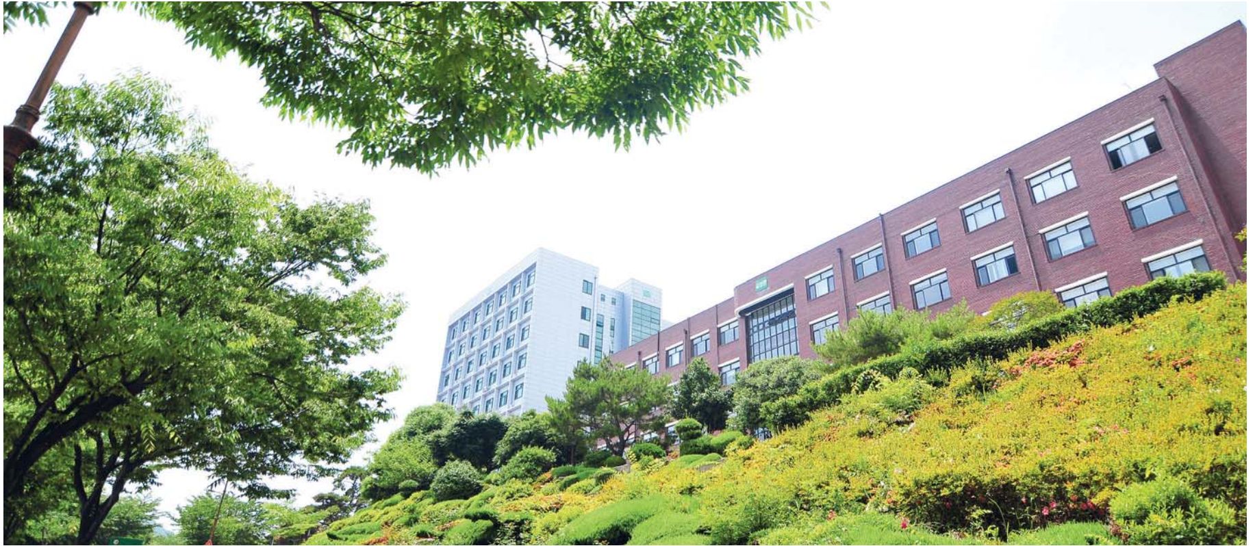
실사구시 교육으로 글로벌 인재를 양성하다