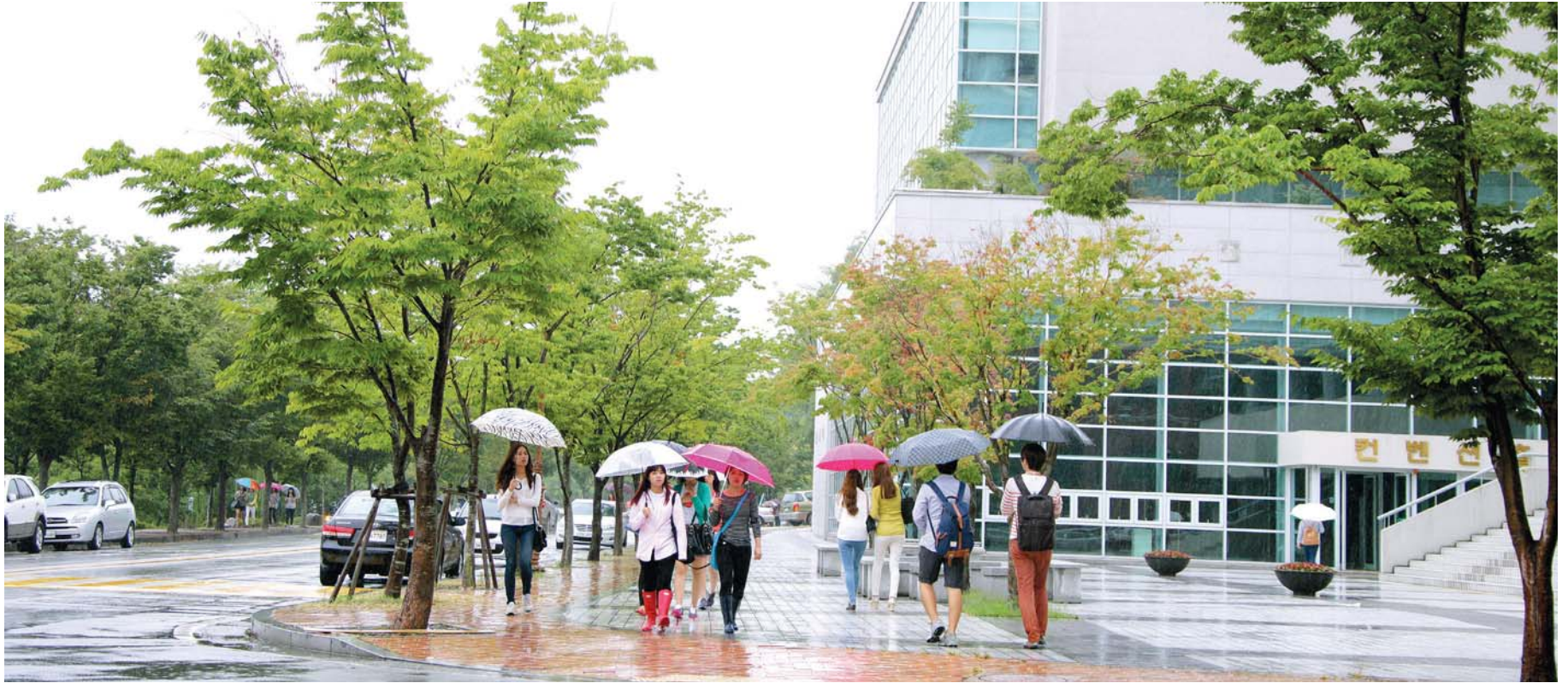
지식을 나누어 꿈을 키우다