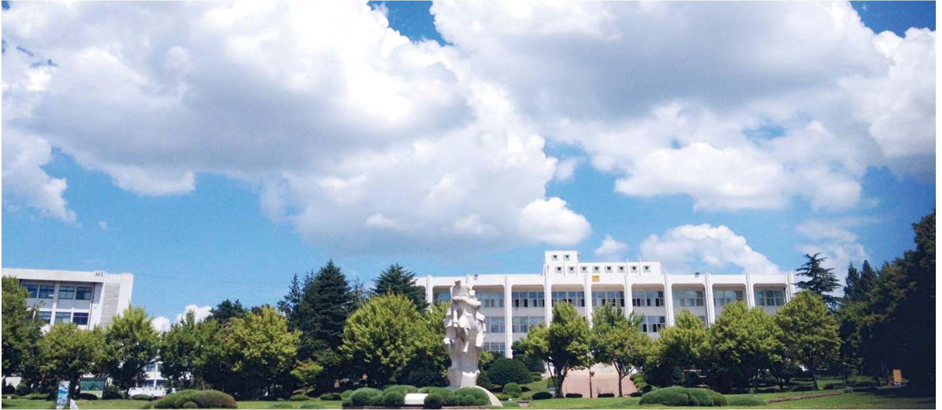
지성의 전당, 학문 공동체를 구현하다