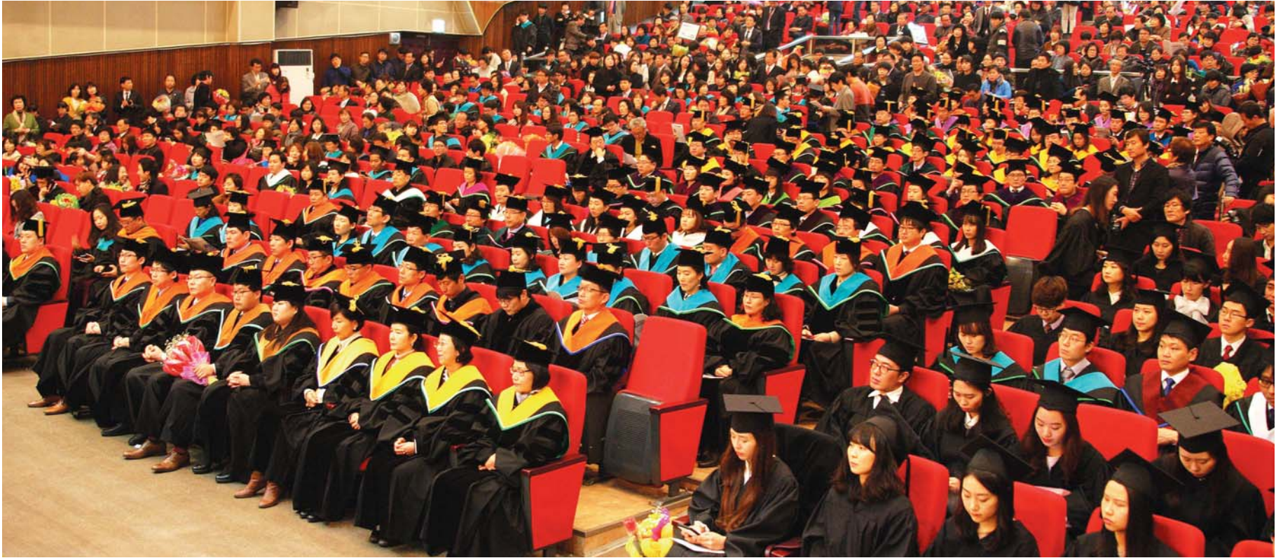
깨어있는 진리로 시대를 선도하다