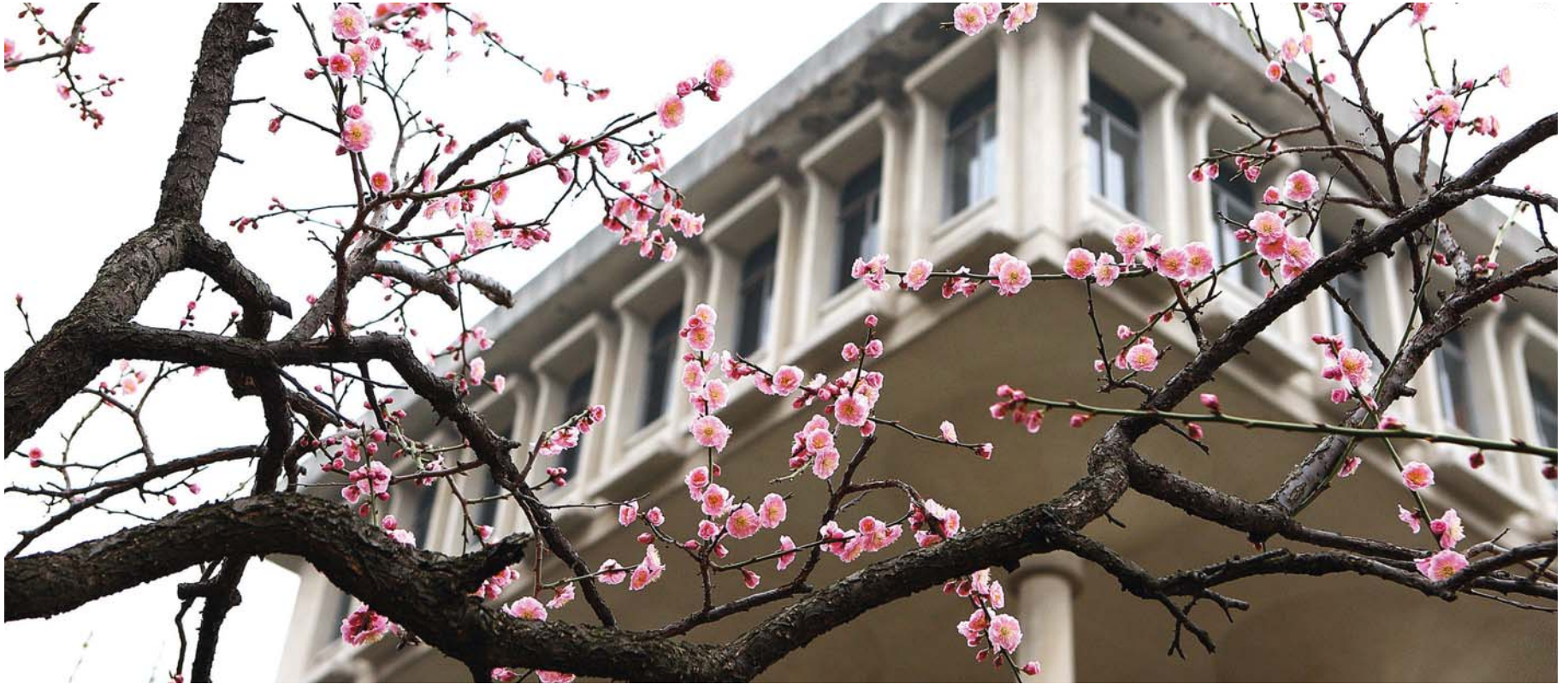
탐구와 창조 의 씨앗을 틔우다