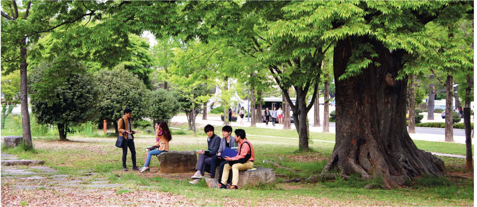
역사 앞에 당당한 '전대인'의 자존심을 세우다