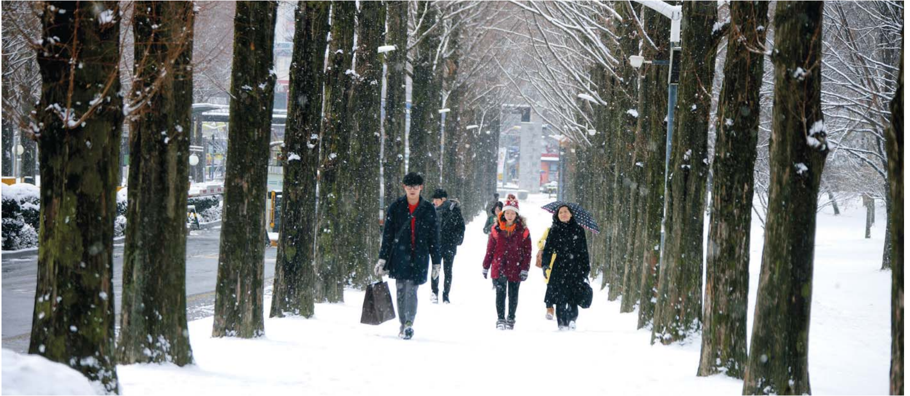
도전과 열정으로 새 희망을 열다