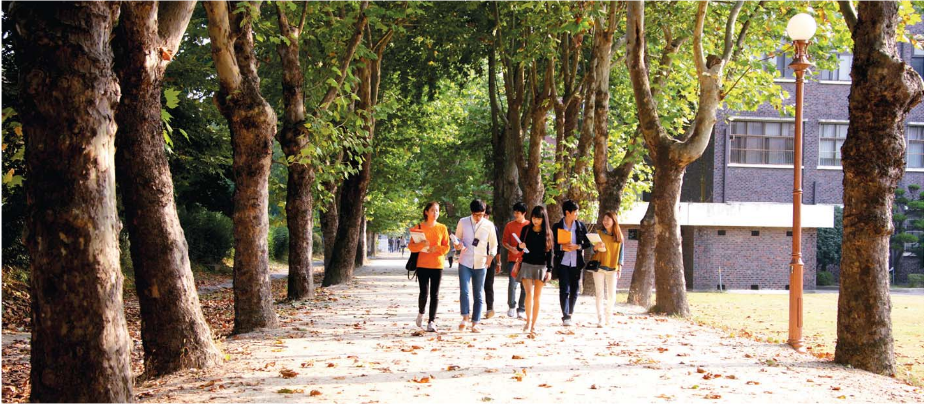
젊음 가득한 교정에 낭만이 깃들다